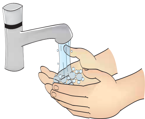
Higienização das mãos